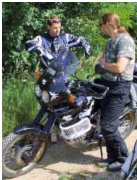
Einstellungssache: Nur wenn die Ergonomie korrekt an die Statur des Fahrers angepasst wird, lässt sich das Mopped richtig lenken.

Der nächste Tag, zehn Uhr morgens. Motiviert bis in die Haarspitzen werden die ersten Runden zum Warmfahren gedreht, dann steht wieder Technik auf dem Programm. »Der Bremsdrift hilft euch, nach einer Abfahrt schneller um eine Kurve zu kommen. Leitet den Drift mit einer entsprechenden Bewegung am Lenker ein und