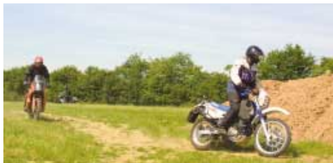
Fahren im Stehen: zunächst ungewohnt, mit der richtigen Körperhaltung aber nicht mehr als reine Übungssache (unten).