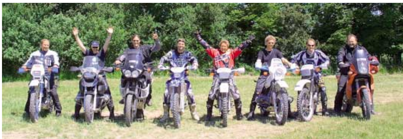
Lustige Runde: Das Dickschiff-Training von dirt4fun ist in erster Linie für Reise-Enduro-Fahrer gedacht. Optional stehen leichte Leihmotorräder zur Auswahl.